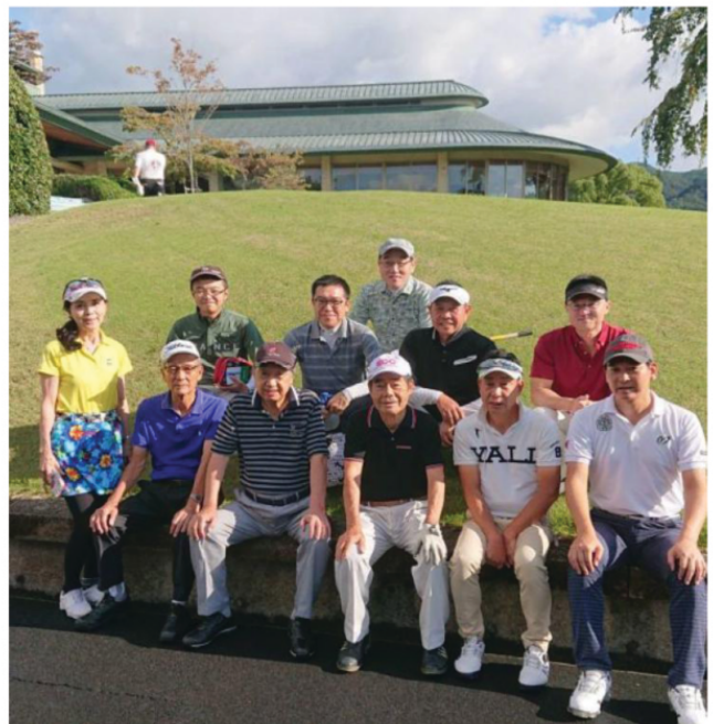
ナガシマカントリー