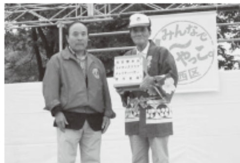
▲花井会長より寄付金贈呈

又、売上金は、来場者が多かったこともあり90,220円となりました。一部は当日ステージで行われました寄付金の贈呈式で手渡されました。多くのメンバーのご協力に感謝いたします。ありがとうございました。