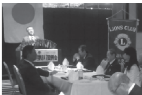
▲西岡会長あいさつ