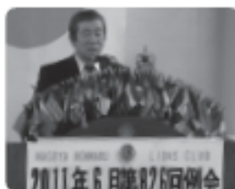
▲児玉会長より最後の挨拶