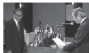
▲会長L児玉より歓迎の挨拶