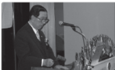
▲L木村閉会のあいさつ