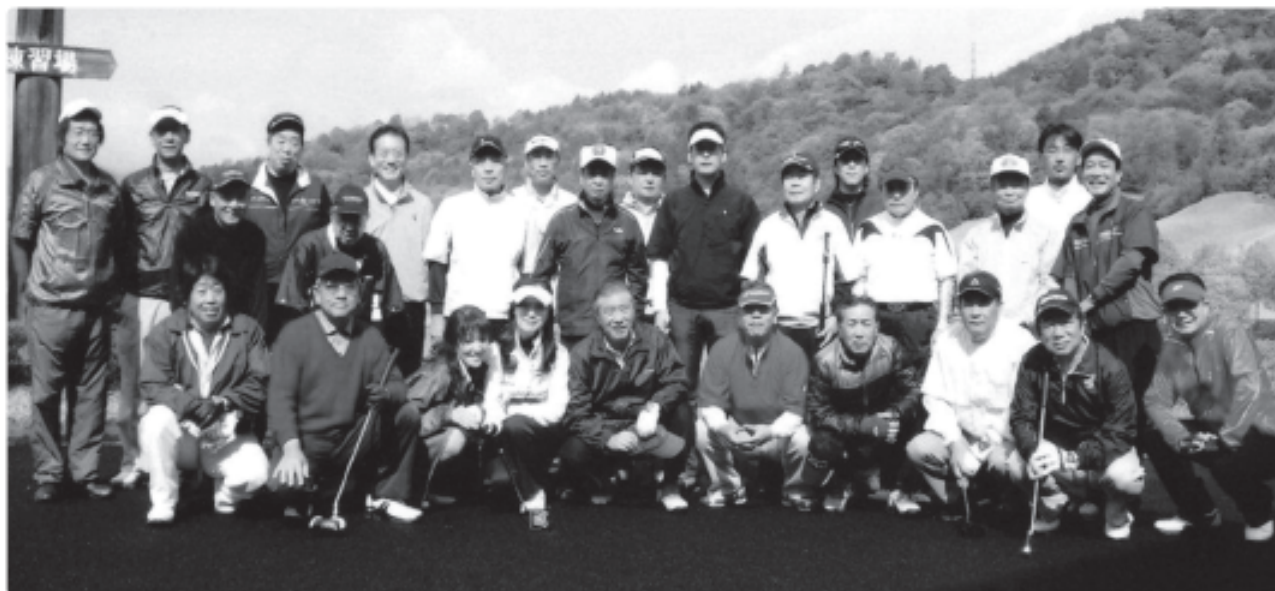
参加者全員の集合写真▲