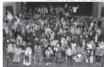
▲参加者全員記念撮影