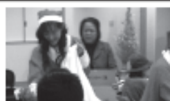
▲L桑原のサンタクロース