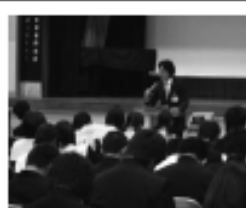
▲講義を熱心に聞く生徒たち

生徒も熱心に耳を傾けてくれていて、薬物乱用防止に対する「ダメ、ゼッタイ。」の正しい知識を身につけて大人になってもこの講習で聞いたことを思い出して、薬物乱用はしない薬物乱用は許さない社会環境を創ってくれる様、願っております。当日は本丸メンバーも忙しい中8名ほど参加して頂きました。本丸LCメンバーの皆さんと学校の先生方に心より感謝いたします。