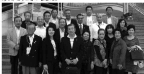
▲東洋東南アジアフォーラム参加メンバー

今年、ライオンズの皆さまの仲間に入れて頂いたばかりの私にとってこの台湾の4日間はずっと学びの連続でした。また、私のような若輩者に皆さまが優しく接して下さい、常にご指導いただけます事を心よりお礼と感謝申し上げます。まだまだこれからライオンズを学び、向上をし、鍛錬をし精進させて頂いていく中で、皆様にご迷惑をお掛けする事やご指導頂く事がございますが、何とぞこれからもお願い申し上げます。また、今回ご参加出来なかった皆さま、ぜひまたの機会にこの体験を実際にして頂き、目に映る感動を、味わって頂きたいと存じます。最後になりましたが、ご一緒して下さいましたメンバーの皆様、貴重な体験をさせて頂きありがとうございました。