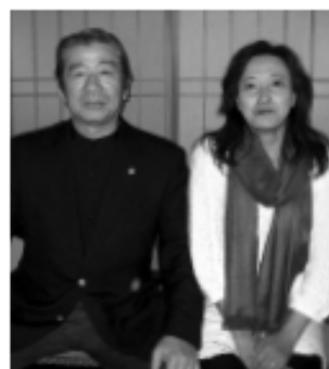
▲緊張気味な会長L児玉夫妻