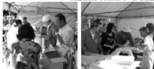
▲大盛況のチャリティーバザー