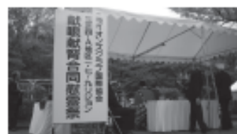
▲1R・7R・9R合同ACT献眼・献賢合同慰霊祭

来賓及びクラブ関係者総勢80名ほどが集まり献眼・献賢をされた方のご冥福を全員でお祈りしました。