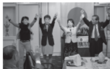
▲新会員によるコマー