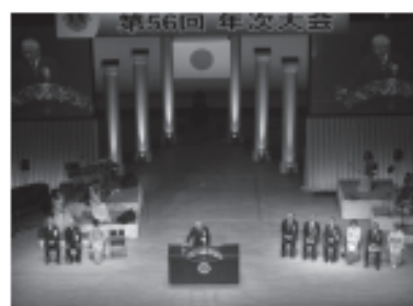
▲334-A地区第56回地区年次大会