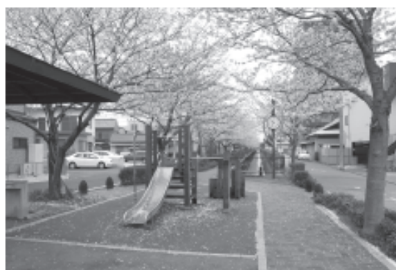
写真：惣兵衛川と公園 (西区枇杷島)